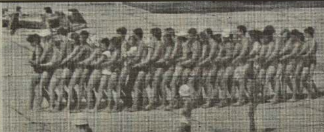
Хождение в "паровозике" на развлечение. Это — общая подпитка энергетической и прочистка энергетических каналов.

Пробыв два дня на семинаре, я уехал и вернулся только тогда, когда до его окончания оставалось три дня. Прежде