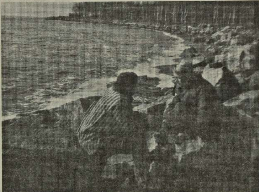
Общение с природой. Ой, поведай, Днепр, о прошедших днях...

Что же касается возможного зла, которое могут причинить с помощью обретенных способностей выпускники