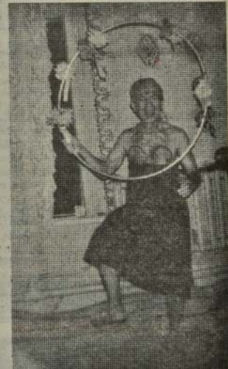
Ну, семинаристы, берегись! Этим же принимает "Создательница".

рального тела, но ощущение полета в данной ситуации было, пожалуй, настоящим. В конце концов на земле уже есть люди, которые развили свои способности до такого уровня, что даже принимали участие в 1-м чемпионате мира по левитации, т.е. в полетах человеческого тела в его материальной форме. Кто знает, не примет ли участие в ближайшем десятилетии в этих соревнованиях кто-нибудь из кривоногих, прошедших обу-