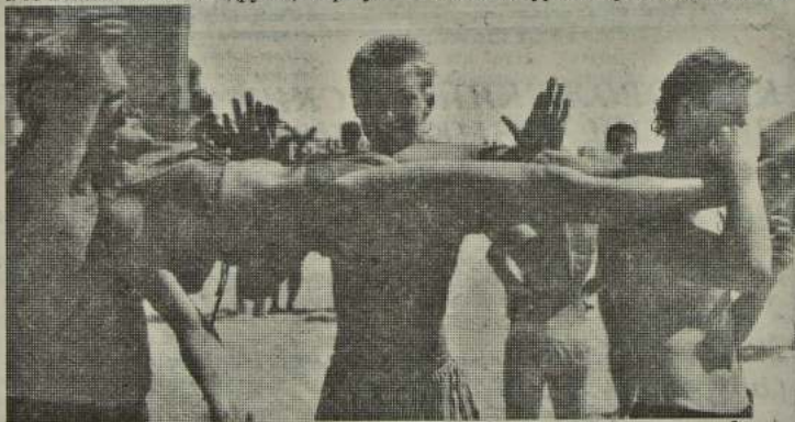
"Состояние бревна". В таком положении дельтовцы могут находиться несколько часов подряд.

Что еще дает обучение на семинаре? Дает толчок к развитию творческих спо-