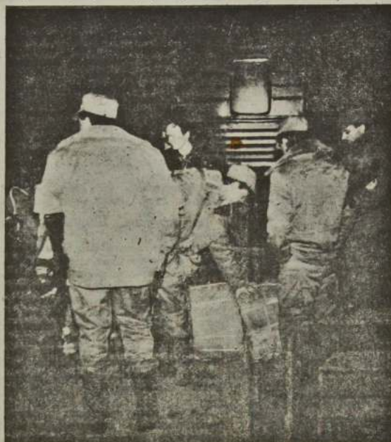
Тирасполь, Ворота Приднестровья.