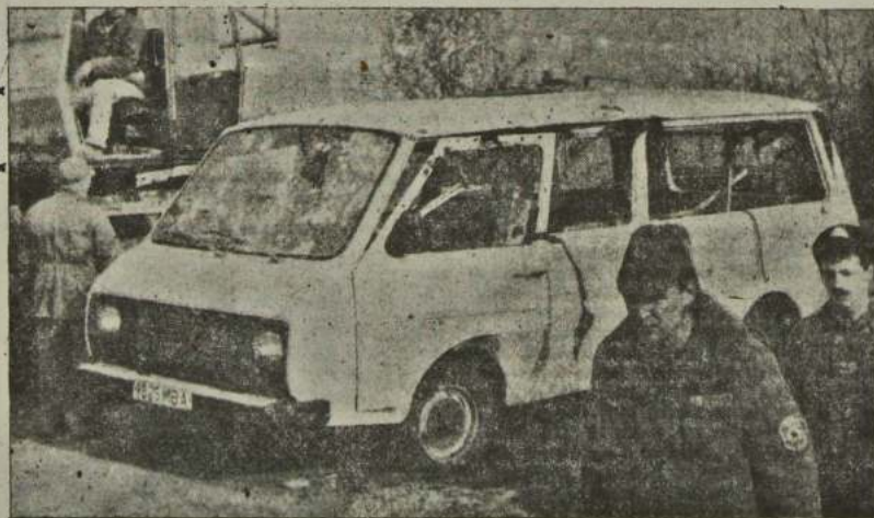
РАФик, изрешеченный пулями полиции.

Исходя из этих угроз, руководство Приднестровья выдвинуло Кишиневу предложение: Приднестровье готово влиться в состав Молдовы на условиях федерации. А если Кишинев решит вступить в состав Румынии, то Тирасполь должно предоставлять право выбора: с кем жить дальше. Правительство Молдовы это предложение приднестровцев категорически отказалось. Да и молдаване, смотря на то, что по обеим сторонам Днестра льется кровь и конфликт внутри Приднестровья в любую минуту может