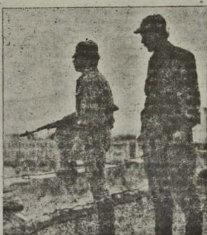
Баррикада гвардейцев на улице г. Бендеры. Через 200 метров отсюда — баррикада полиции.