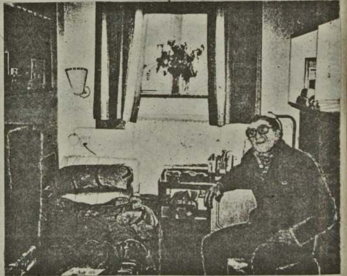
● В камере шведской тюрьмы.