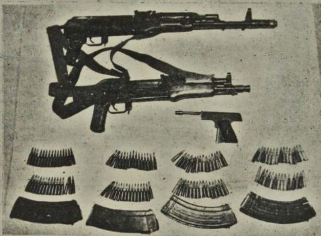
На снимке: оружие и боевые патроны, изъятые у «гостей» с Кавказа.