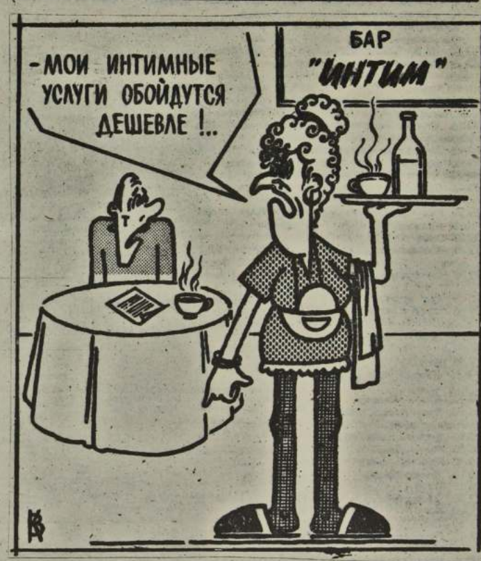
Рис. В. Кондратовича.

В зале суда. — Знаете ли вы, что вас ожидает за дачу ложных показаний? — Да. Мне обещали «Жигули». — Ты что, разводишься с мужем? — Да. Он мне изменяет. — Не подумай о детях! — Ах, с таким ловеласом нельзя быть уверенной, что это его дети! — Муж и жена смотрит по телевизору балет на льду. Муж: — Ого! Вот с этой женщиной я бы исполнил произвольную программу! Жена выключает телевизор! — Ты сначала научись исполнять обязательную! — Судья, твоя королева палит!