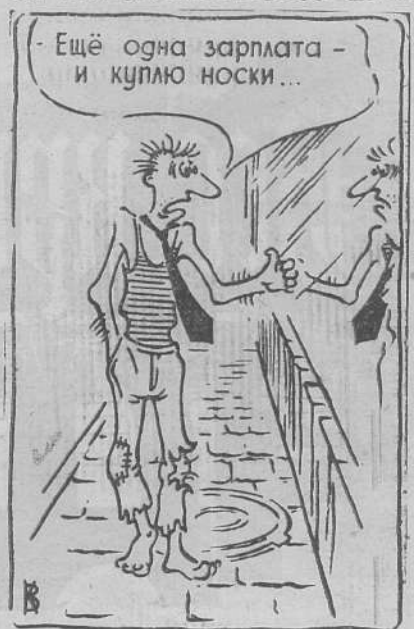
Рис. Виктора КОНДРАТЕНКО.