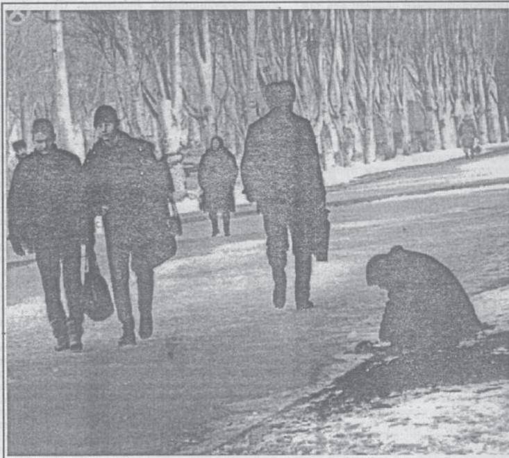
Старушка плачет у обочины, а мы - делаем озбочины?